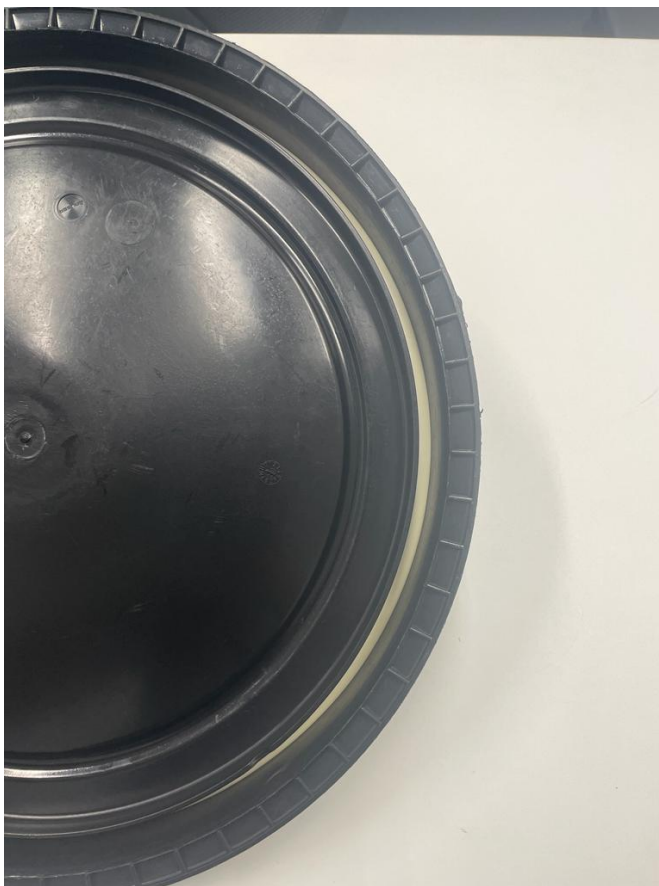
Figura 10: Face interna da tampa da bombona destacando a presença do anel de vedação.