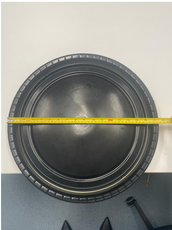
Figura 8: Diâmetro externo da tampa da bombona.