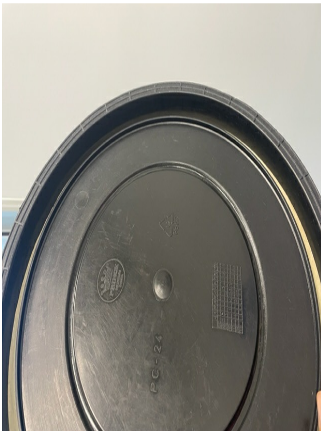
Figura 5: Tampa da bombona modelo: Detalhe da face interna da tampa, destacando o anel de borracha de vedação e a forma de encaixe da tampa "não rosqueável".