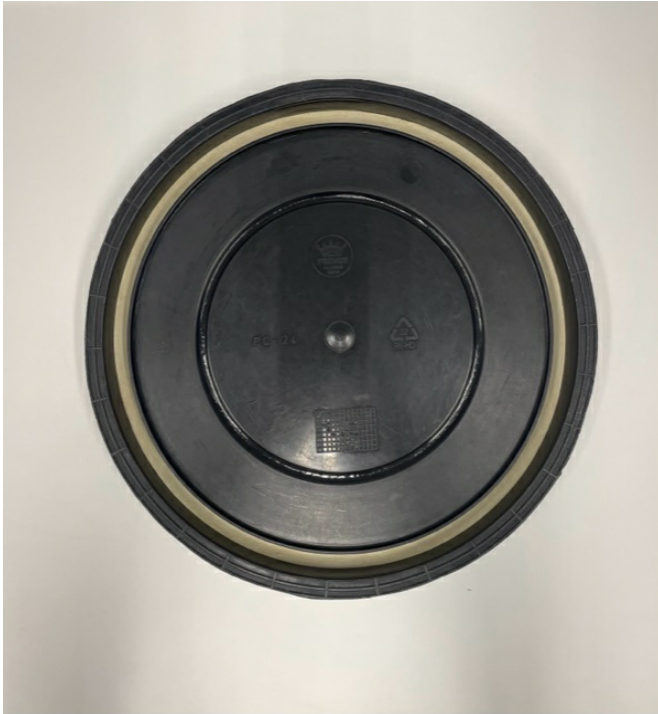
Figura 4: Tampa da bombona modelo: Detalhe da face interna da tampa, destacando o acabamento com anel de borracha para garantir o fechamento sem vazamentos.