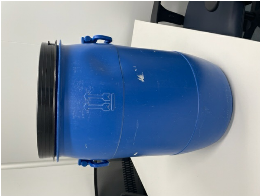
Figura 1: Modelo da bombona: Bombona azul, com 2 (duas) alças, indicação do "lado de cima" gravado no corpo da bombona, tampa preta.