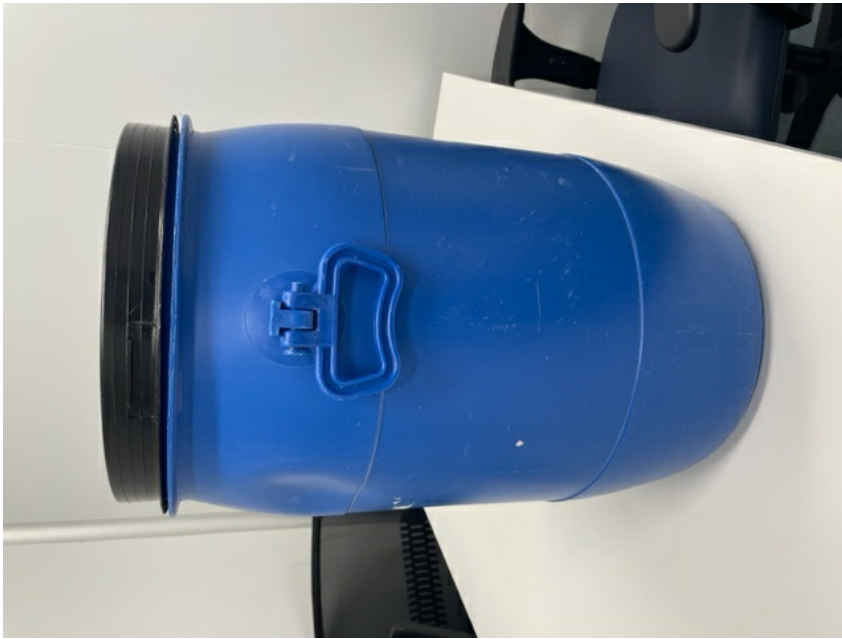
Figura 3: Modelo bombona: Detalhe da alça.