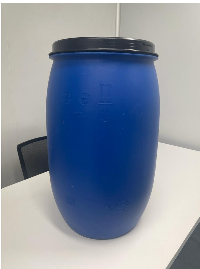
Figura 6: Bombona com tampa 100L.