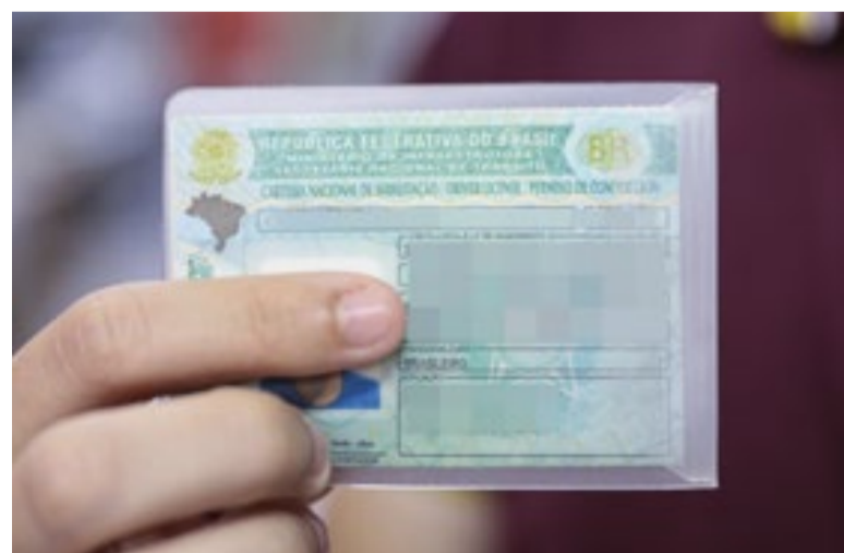
Exame toxicológico será obrigatório também para candidatos à primeira CNH